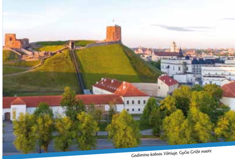
Gedimino kalnas Vilniuje.

Renginys kviečia pažvelgti į Trakus kitaip – išvysti miestą nuo Aukų kalno, ant kurio ir buvo jo užuomazga – kunigaikščio Kęstučio įsakymu pastatyta pilis. Sekmadienio popietę mistiški kanklių garsai kvies lipti ant droviai už mūrų stūksančios kalvos, lyg skraiste prisidengusios vešlia lapija. Lipdami ant kalno eisime į savo ir miesto praeitį – prie ištakų. Kartu panirsime į vieno iš svarbiausių Lietuvos piliakalnių istorinę praeitį – regėsime kylančią naują Salos pilį, egzotiškais gyvūnais garsėjantį žvėryną,