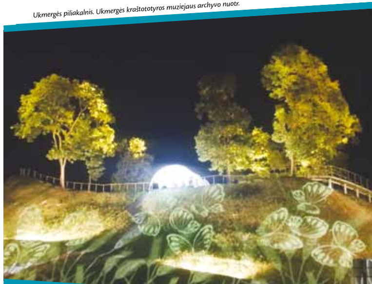
Biržų piliavietės kalvos.

Ukmergės piliakalnis.